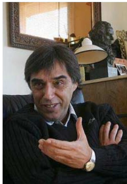
El director Agustín Díaz Yanes.