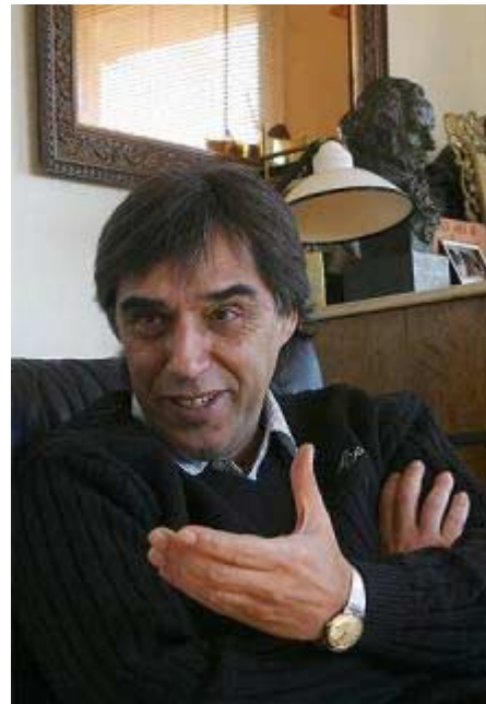
El director Agustín Díaz Yanes.